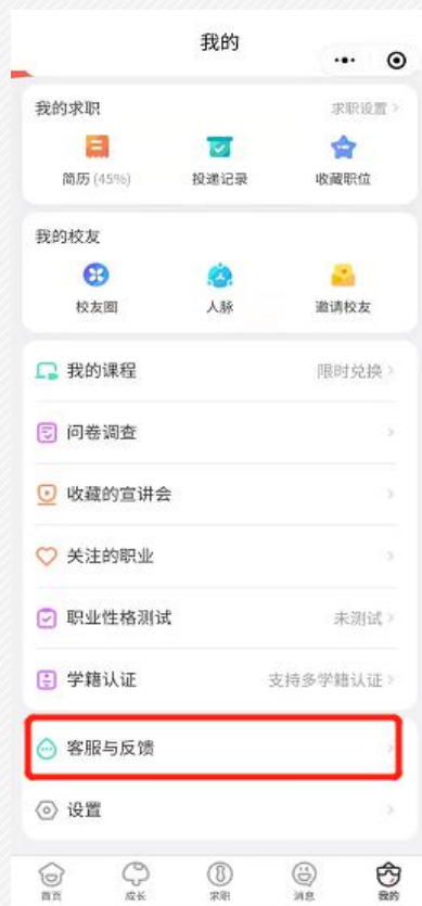
我的-客服与反馈入口