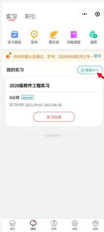
实习模块客服中心入口